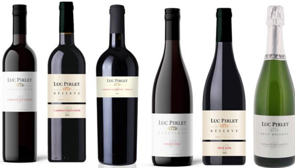
Bordeaux Bordeaux Elite Bordeaux Conisch Bourgogne Bourgogne Elite Champagne